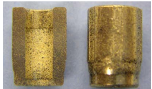
写真 1. 軸受外観及び内径形状

AV 機器、TV 等に使用されるシステムの為、ノイズや振動の発生は、極端に嫌われる。そこで図. 1 の様な中逃げ軸受を使用する事によって、軸と軸受のクリアランスを3μm以下に設定しても、軸受ロスの問題もなく、振動ノイズの低減を計る事が可能となった。